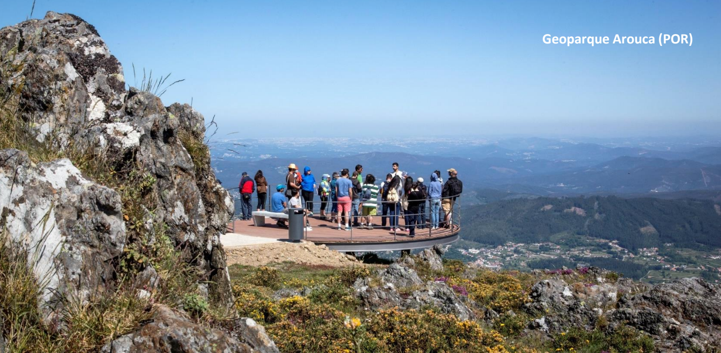
Geoparque Arouca (POR)